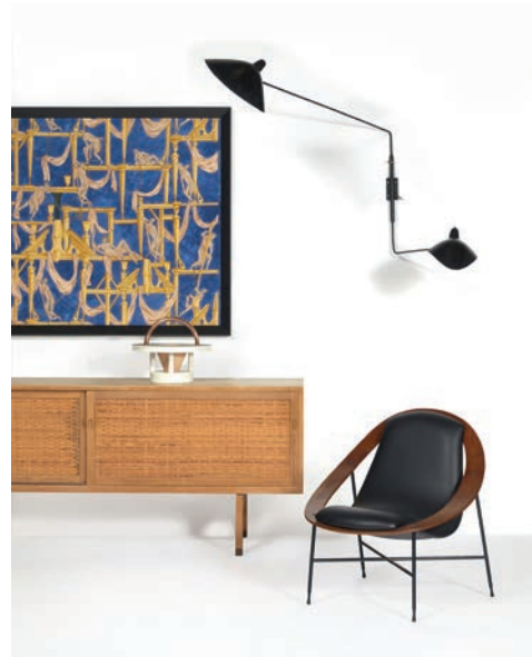
Collection de design européen