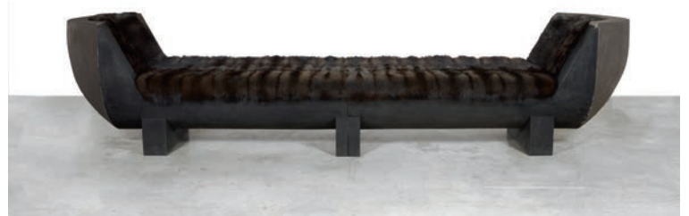
Rick OWENS (né en 1962) Double Bubble, Banquette Double Récamier, 2007 Estimation : 30 000 - 40 000 €