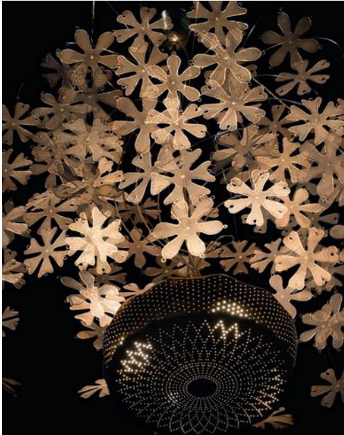
Paavo TYNELL (1890-1973) Importante suspension mod. 9014 dite « Snowflake Number 1 » serie Fantasia - 1947 Très rare exemplaire à 96 flocons Estimation : 120 000 - 150 000 €